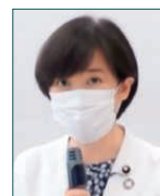
▲堀内環境副大臣セミナー。