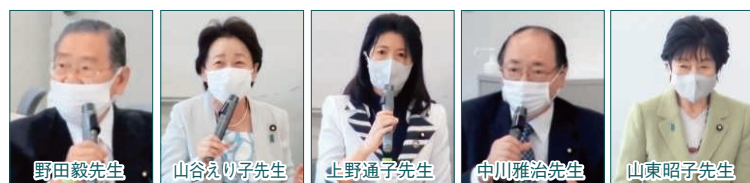
▲忙しい時間を割いてご挨拶いただいた栄養士議員連盟役員の先生方。