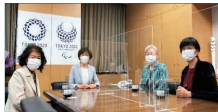
▲堀内詔子東京オリパラ担当・ワクチン接種推進担当大臣