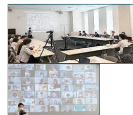
▲第46回通常総会 Webでの参加者。