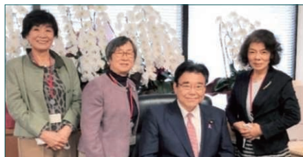
▲後藤茂之厚生大臣