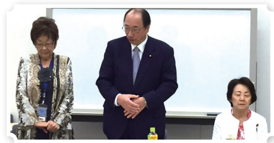
右から栄養士議員連盟 山谷えり子幹事長代理、栄養士議員連盟 中川雅治事務局長

本年度は支部長会議が、年1回の実施となったことから、それに代わるものとして地区幹事及び職域幹事、監事の出席で10月12日(水)参議院議員会館会議室で開催しました。新役員の紹介、要望事項についての協議等を行いました。